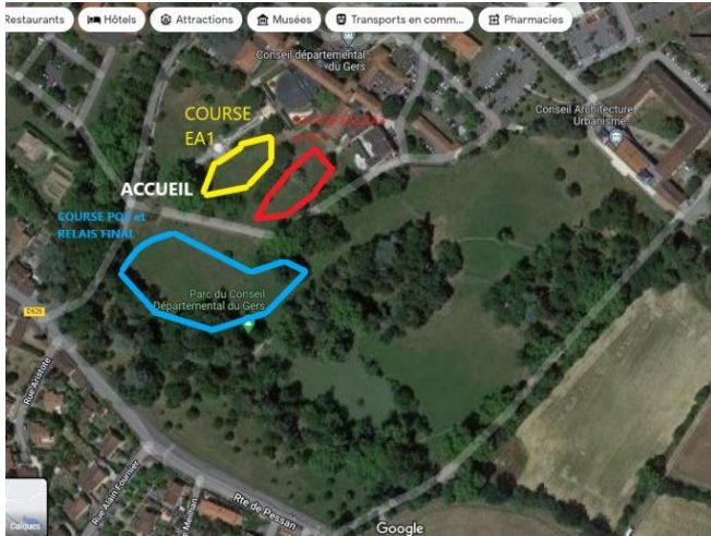
Emplacement des courses