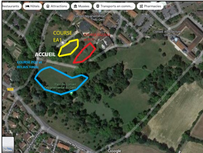
Emplacement des courses